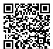
「阿木特産営農 & 阿木村づくり塾」のフェイスブック

のは難しいですが、その風土だからできるコシの強さやのど越しの良さは手打ち蕎麦屋さんをつならせるほどです。 収穫したソバは、同地区のキャンプ場などを運営している(株)阿木レイクサイドが「安岐そば」として加工・販売しています。また、中津川市の「更科」をはじめ恵那市や可児市、遠くは三重県まで、計16件の蕎麦屋に提供され、味わうことができます。