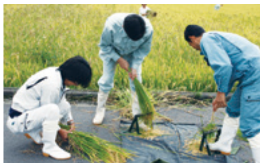
▲実測調査のようす

全筆調査が適正に行われ、評価地区間の均衡が取れているかを検証するため、任意に被害筆を抽出し損害評価会委員の検見による抜取調査や組合職員による実測(坪刈り)調査を実施し、評価地区間の差を調整します。