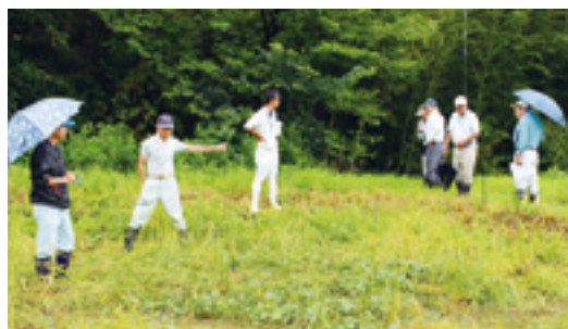
▲全筆調査のようす

被害申告のあったすべての筆について、各地区の損害評価員が検見による全筆調査を行い、見込単収を決定します。また、管理が不十分な筆に対しては、公平を期するため分割評価をし、適正に管理された筆と見込収穫量に差をつけます。