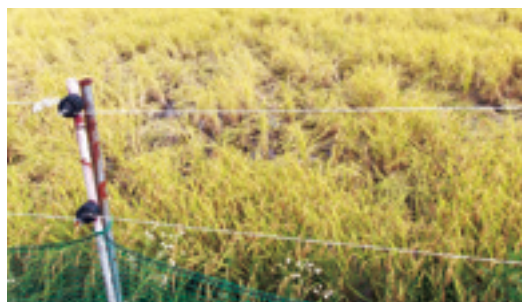
▲イノシシの害に遭った水田