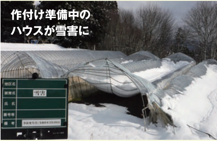
作付け準備中の ハウスが雪害に

近年の暖冬により、春先の作付け準備が年々早まる傾向にあるなか、今年の冬はラニーニャ現象の発生が予想されており、厳しい寒さや大雪になる可能性があります。突然の気象の変化による被害から大切な資産を守るため、経営安定の一助として、園芸施設共済に加入しましょう。