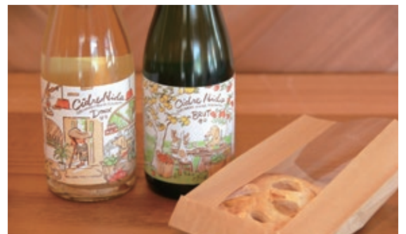
▲かわいらしいラベルが印象的なシードルは、甘口と辛口が楽しめる。手前のアップルパイも人気の商品

🍎 商品はお店以外で買うことはできますか。 シードルだけでなく、リンゴジュースやジャムもオンラインショップでお求めいただくことができます。個人用だけでなく、プレゼント用にもおすすめです。