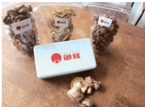
▲御茸の商品は赤いトレードマークが目印

日本では昔からカツオやコンブ、シイタケから出汁を取ってきました。食文化を守ることに、次の世代の子供たちの味覚や健康を守ることに繋がると思っています。そのためにも、今後も本物の「木の子」を後世に残していきたいです。