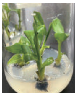
▲岐阜大学と共同研究で開発された信長バナナの苗