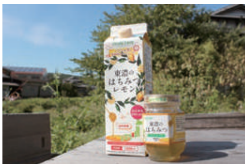
▲はちみつを贅沢に140g使用するはちみつレモンは、コクのある甘さが特徴

加工品も展開し、はちみつレモンを郵便局で販売中です。また、はちみつを粉末状にし、砂糖の代わりに使用した栗きんとんも限定販売しています。今後は、従業員を10人程度雇い、地域養蜂の発展に貢献していきたいです。