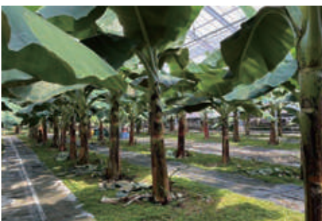
▲苗の定植後、およそ1年でここまで成長する信長バナナの木

全国に普及させることはもちろん、海外にも信長バナナを広めたいと思っています。また、バナナの葉を使ったペットフードや家畜用飼料の生産にも今後取り組みたいですね。